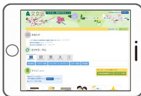
利用者端末イメージ画像

ご利用できる時間は施設の開設時間内までです。また、施設の設備保守点検等により、利用者端末がご利用いただけない場合があります。