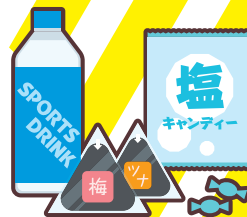
運動会やスポーツ大会への 飲食物の差し入れ