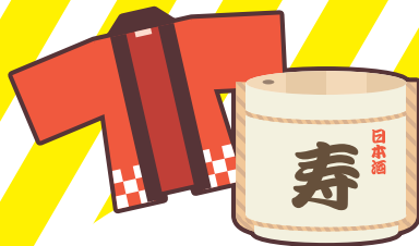
お祭りへの寄附や差し入れ