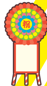
落成式・開店祝いの花輪