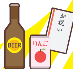
町会の集会や旅行等の 催し物への寄附や 飲食物の差し入れ