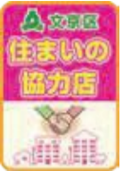
▲文京区住まいの協力店ステッカー

*文京区住まいの協力店:不動産関係団体から推薦を受けた、地域の物件情報に精通するまちの不動産屋さん。「すまいる住宅」の仲介のほか、高齢者等に対し、適切な民間賃貸住宅の情報を提供します。