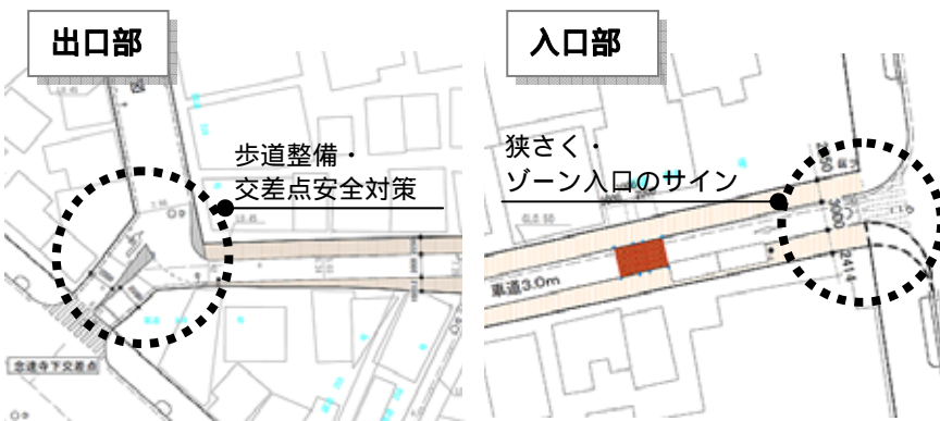
図-1 区道 816 号における安全対策案

歩道の拡幅や交差点の安全対策、ハンプや狭さくによる車両走行速度抑制対策を検討しています。