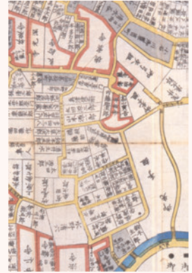
『東都小石川絵図』(部分)

短冊形の街路は神楽坂に近い新宿区中町、南町にも残っているとのことですが、私はその近くの市谷田町に居住していたこともあり、短冊形の街路に縁が深いのかも知れません。