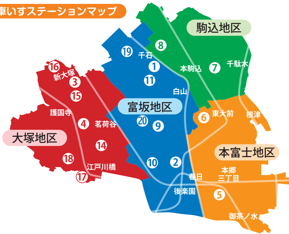
車いすステーションマップ