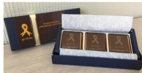
チョコレート(6個入り)

いただいたご芳志は当会を通して、世界の途上国の小児がんの子どもたちの支援と、日本の小児がん患児・家族支援のために活用させていただきます。