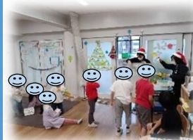
たの かい ようす お楽しみ会の様子↑