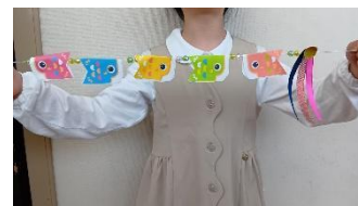
こいのぼりガーランド