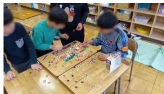
ジグソーパズルに挑戦！