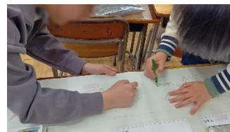
新しいスタッフ紹介の作成