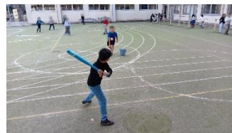
ホームランダービー