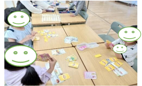
(レシピでお腹空いたね！)