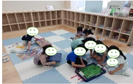
(色々なおもちゃで遊んでね?)