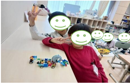
(仲良し2人！ラキューで寒いもの作ったよ。)