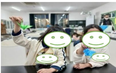
素敵な鶴が出来上がったよ!