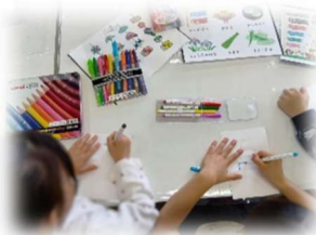
こどもの日工作。1年生は初めての工作です！