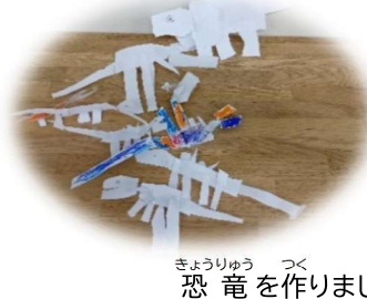
きょうりゅうつく 恐竜を作りました！