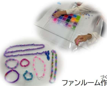
ファンルーム作り