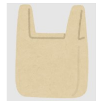
エコバックやハンカチに！