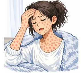
※イラストは文章生成AIにより作成