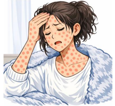
※イラストは文章生成AIにより作成