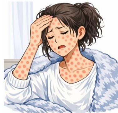
*Hình minh họa được tạo bởi AI