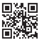
医療機関情報検索システム