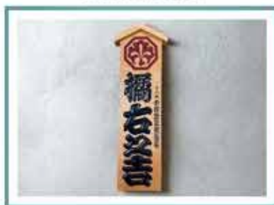
招き看板 【江戸文字】橋石之吉 文京区技能名匠者