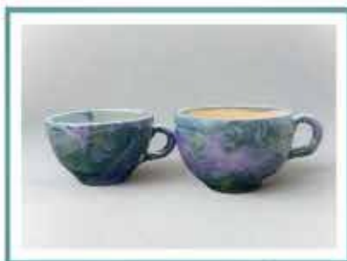
マーブル柄カップ 【陶芸】渡辺みゆき 文京区技能名匠者