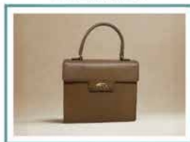
ハンドバッグ 【革工芸】杉崎信雄 文京区技能名匠者