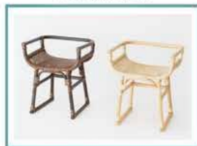
TOU KOISU 【東京藤工芸】木内秀樹 文京区技能名匠者