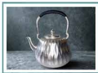
純銀鶴羽紋湯沸 【東京銀器】石黒光南 文京区技能名匠者