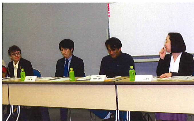
今回新たに公募委員となった皆さん

30 年度上半期のBーぐるの運行実績に関し、「千駄木・駒込ルートは 1 日当たり 1,374 人で 2 年連続で微減、同じく目白台・小日向ルートは 1,277 人で前年と比較して微増で推移」と報告がありました。これにより、2 ルートとも区で定めている公的支援の基準の目安であるバス一台当たり一日 300 人を達成していることが確認されました。