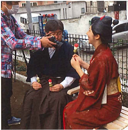
沿線地域情報番組（いちようさん）の撮影風景（左）と車内情報誌 people（びーぷる）

三つ目の夏休みBーぐる親子洗車ツアーはBーぐる友の会の活動の中でもっとも大きなイベントで、今年は8月25日土曜日に開催することができました。今年は区報に加えインターネット上でも募集したこともあり、前年を上回る99組288人の中から抽選で選ばれた14組40人が参加しました。