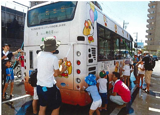
夏休みBーぐる親子洗車ツアー

当日は好天にも恵まれ、また区民課や日立自動車交通、日立オートサービスの皆様のご協力をいただきながら、大変盛況な中、安全にイベントを終了することが出来ました。この場をお借りして改めて御礼申し上げます。