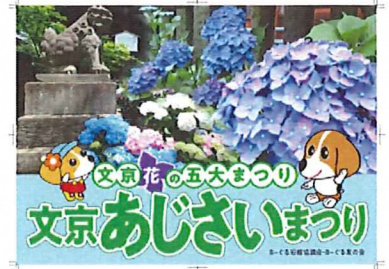
花の5大まつりステッカーの掲出

このほかにBーぐる友の会名で実施している活動があります。文京花の五大まつりの開催に合わせてバスの前面にステッ