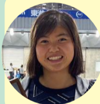
講師紹介 長谷川涼香選手

株式会社東京ドーム所属 3歳から水泳を始め4歳には4泳法をマスターし5歳で選手コースに所属。中学記録、高校記録保持者。 2016年リオデジャネイロオリンピック出場 2021年東京オリンピック出場