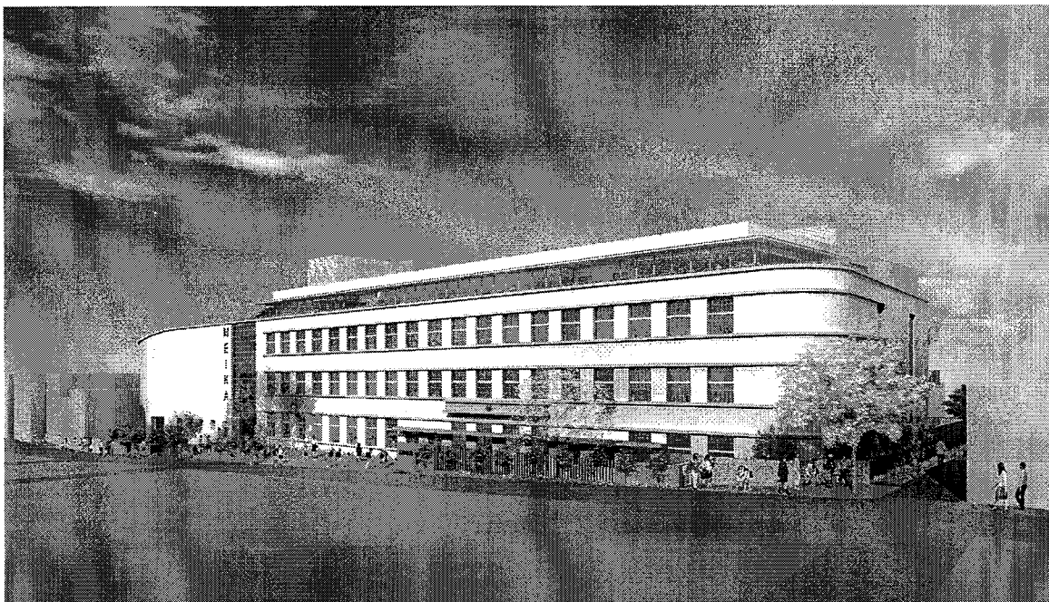
■北側前面道路側外観