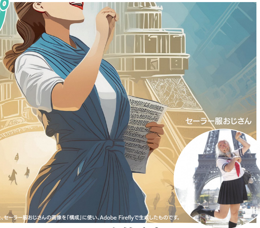
セーラー服おじさん