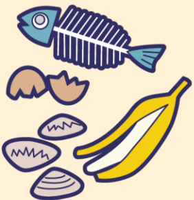
生ごみ・貝がら (生ごみは水分をよく切る)