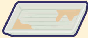
汚れの落ちないプラスチック