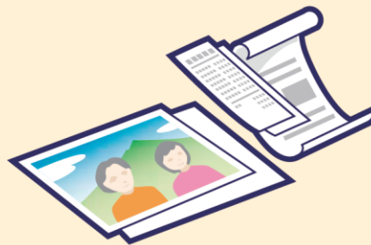
リサイクルできない紙 (写真・カーボン紙・ビニールで加工した紙等)