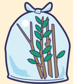
少量の草木 (30cm以下に切って袋に入れる)