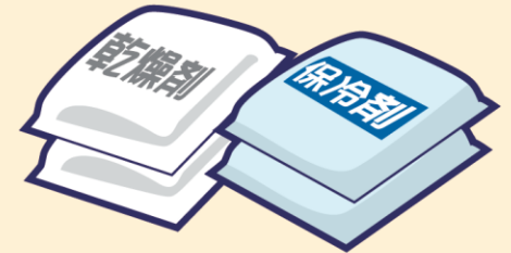
その他(乾燥剤・保冷剤等)