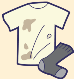
汚れている衣類・布類