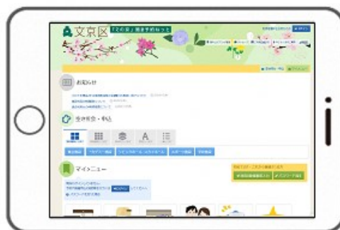
利用者端末イメージ画像

ご利用できる時間は施設の開設時間内までです。また、施設の設備保守点検等により、利用者端末がご利用いただけない場合があります。