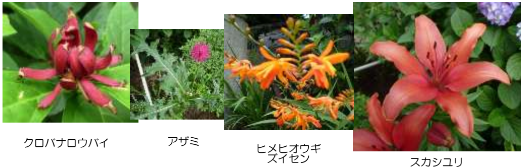
クロバナロウバイ