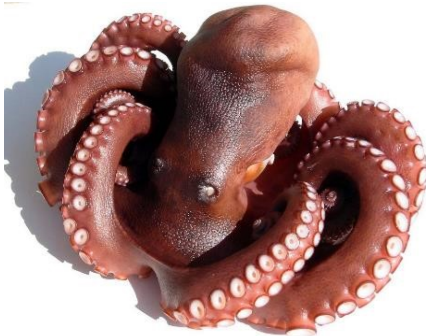
関門海峡たこ（絶妙な湯で加減のゆでだこを冷蔵で出荷）