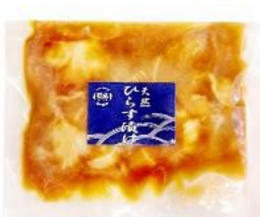
漬け(※写真はひらす漬け)