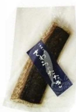
一本釣りさわらのたたき