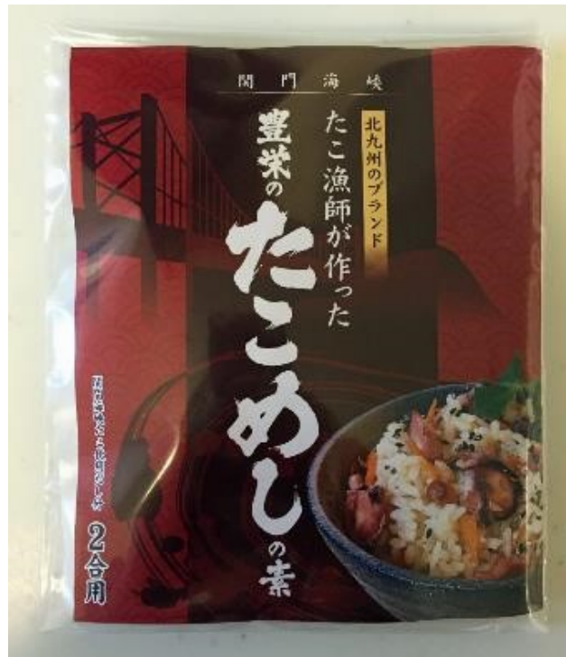
豊栄のたこめしの素