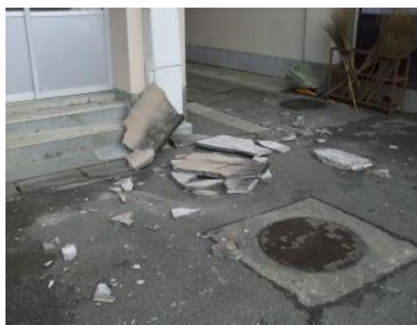
モルタル片の脱落