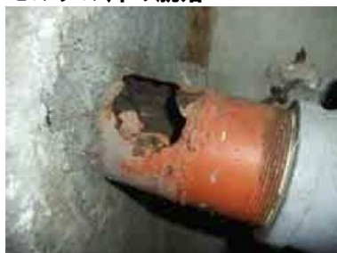
劣化による配管の破損