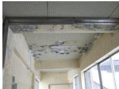
雨漏りによる天井の劣化