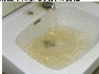
給水管劣化による赤水の発生